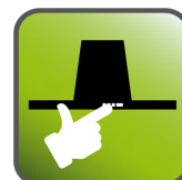
Tlačítka Soft touch