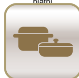
Funkcia detekcie riadov