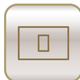
2 v 1 vstavný odsávač v indukčnej platni